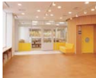
靴をぬいでくつろげる「子ども室」