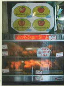
かわいいポスターが目印。

明治45年創業の老舗の肉屋で、現在は肉の卸と惣菜を販売しています。山形出身の女将さんが発案した看板商品「りんごコロック」の中には、ホクホクのじゃが芋とシロップ漬けのりんご、挽肉、玉ねぎが入っています。挽肉のジューシーさと、真ん中にコロコンと入っている甘いりんごの組み合わせは、一度口にするとなぜか忘れられない味わいです。神田に嫁いであらうとこの街を見てきた女将さんの話はとても興味深く、人柄の良さや笑顔が印象的です。