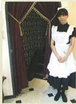
ここから、別世界へ… (メイド喫茶ではありません)

「秋葉原に女性が1人でもくつろげる場所を」と昨年12月にオープン。正統派の仏蘭西菓子と珈琲・紅茶、さらに、厳選素材を使用した洋食も楽しめます。グラスなどの小物類やトイレの内装に至るまで上質感たっぷり。常連さんだけが案内してもらえると、という3階の会員制サロンは、さらにゴージャスな空間で優雅なひとときが過ごせます。