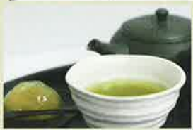
厳選煎茶(お菓子付き) 茶・水・茶器・技すべてにこだわった一級煎茶

今年9月にリニューアル。日本茶を中心に、オリジナルスイーツやドリンクが楽しめるカフェです。水にもこだわり、天城山系の天然水を毎日運んでいるそうです。夜も気軽に立ち寄れるよう、生ビールや軽食の価格を350円に設定。店内は完全分煙で、無線LANも使用でき、打ち合わせやPC作業に利用する姿も見られます。スタッフには日本茶インストラクター資格所有者もいるので、おすすめを聞いてみてはいかがでしょうか。