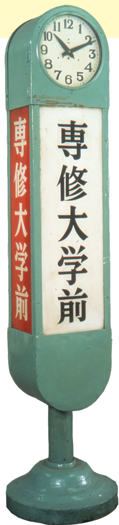
靖国通り沿いにあった都電の「専修大学前」停留所

初めて千代田区に路面電車が走ったのは明治 36 年のことです。数寄屋橋から神田橋までの路線が開通し、日比谷・大手町に停留所が設置されます。そして明治 44 年、東京市電気局（東京都交通局の前身）が開局し、路面電車が公営化されると、官庁や学校の多い千代田区には数多くの停留所が設けられるようになりました。千代田区発展を路面電車が陰ながら支えていったと言えるかも知れません。