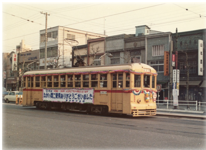
新宿駅～岩本町間を走る都電。昭和 45 年 3 月 27 日に惜しまれながらも廃止されました

残念ながら昭和 47 年 11 月、荒川線を残して都内を走る路面電車はその姿を消しました。本展示は東京都交通局設立 100 年を記念して、路面電車が走っていた頃の懐かしい千代田区の風景をご紹介します。ぜひ往時の姿を知っていただければと思います。