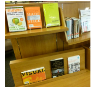
【終了しました】 書フロア セク ション展示『ご存知 か？アメ...