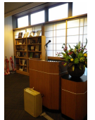
アメリカンシェルフ 調印記念式