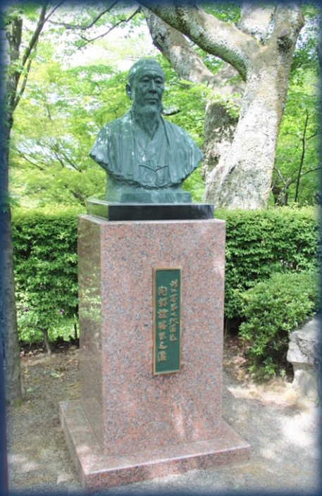
間部詮勝胸像(鯖江市西山公園「嚮陽溪」)