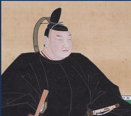
井伊直弼画像（清涼寺所蔵）