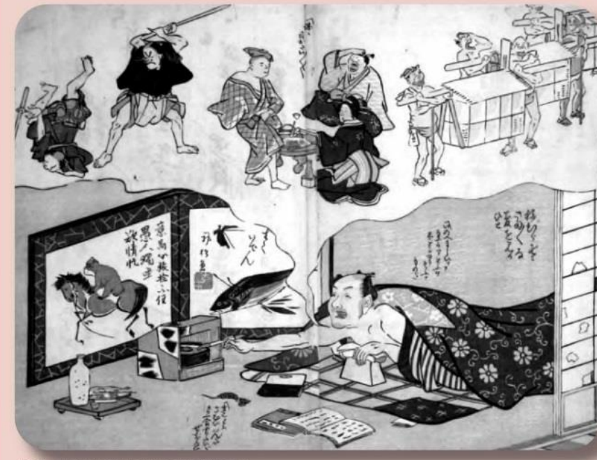
「浮世八夢だ夢だ」作者不詳/慶応期(後期展示)

江戸中期の鳥羽絵から始まり、江戸のヒットメーカーであった歌川国芳、幕末・明治に活躍した河鍋晩斎など人気浮世絵師が描いた戯画や、明治・大正期の作品、昭和初期の数々の漫画雑誌まで、京都国際マンガミュージアム所蔵の貴重なコレクションにより、日本マンガの足跡をたどる旅をお楽しみ下さい。 鳥羽絵・ポンチ・漫画 江戸からどら マンガの旅