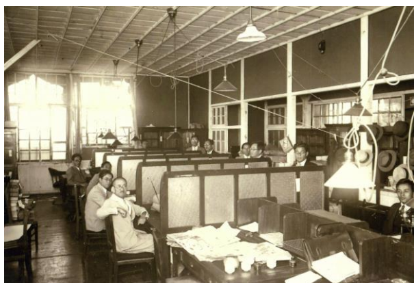
【内務省警保局図書課の検閲官たち】昭和7年頃